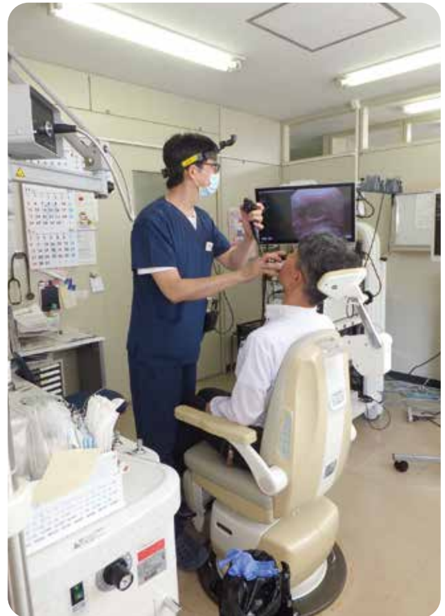
3診ある外来の診察室のすべてに電子スコープが設置されており、超音波装置などの医療装置も充実されています。

■ 一般外来のほかに、めまい外来や補聴器外来などの専門外来も開設しています。専門外来の診察は一般外来（初診）を受診し、問診や必要な検査を行った後に専門外来の予約をします。専門外来での診断、治療法の決定後は当院での治療やリハビリのほか、かかりつけ医への紹介も行っています。