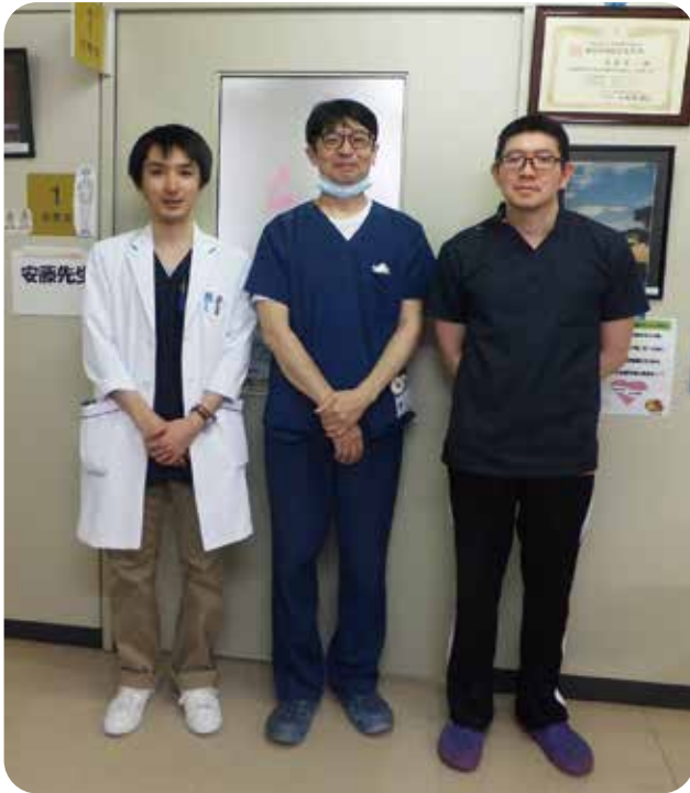
左から 川浦医師・安藤診療科部長・高島医師

■ 誤嚥性肺炎も大きな問題となっていますが、肺炎までにはいたらない患者も多くみられます。外来で簡便に行える電子スコープを用いた嚥下内視鏡検査（VE）やX線透視下での嚥下造影検査を行い、嚥下の評価・治療を行っています。